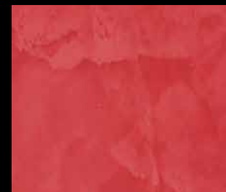
ROSSO POMPEI BT30