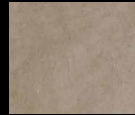
MAPLE SAP BT07