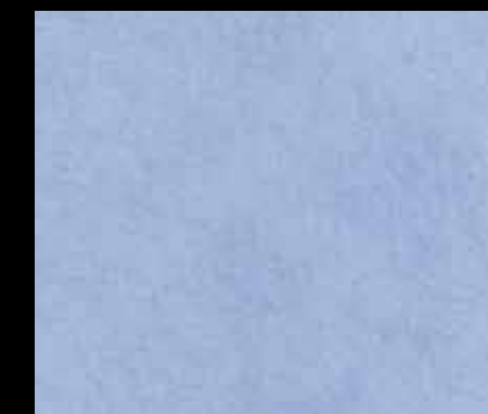
GOOD DAY BT26