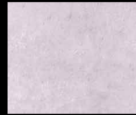
MOON RISE BT03