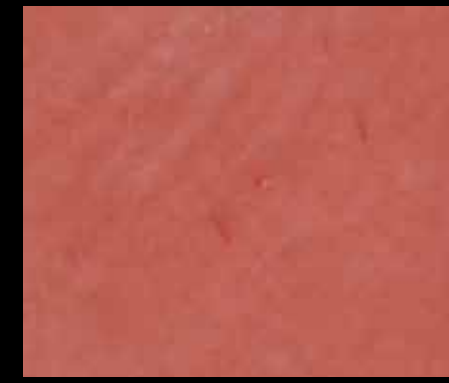
ROSSO ANTICO BT18