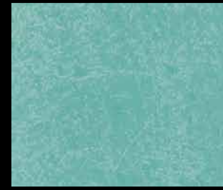
VERDE VERONA BT16