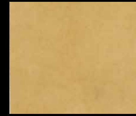
CIPRO D BT8