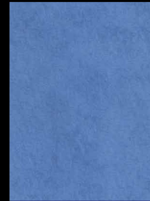
BLU OLTREMARE BT28