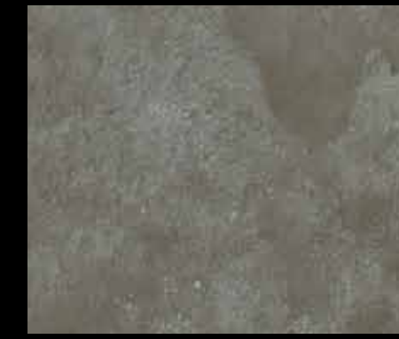
NERO GERMANIA BT29