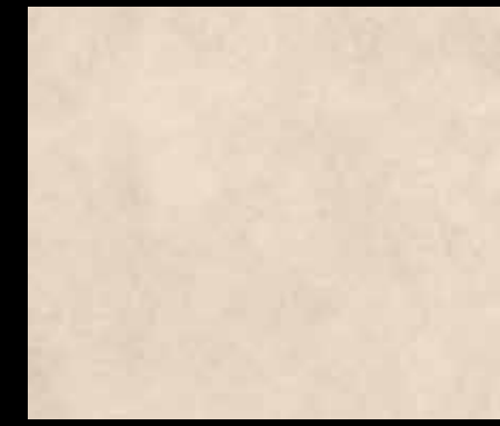
SIENA NAT BT05