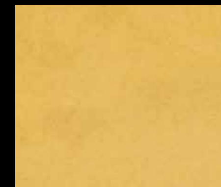
GIALLO ARTIGLIERIA BT25